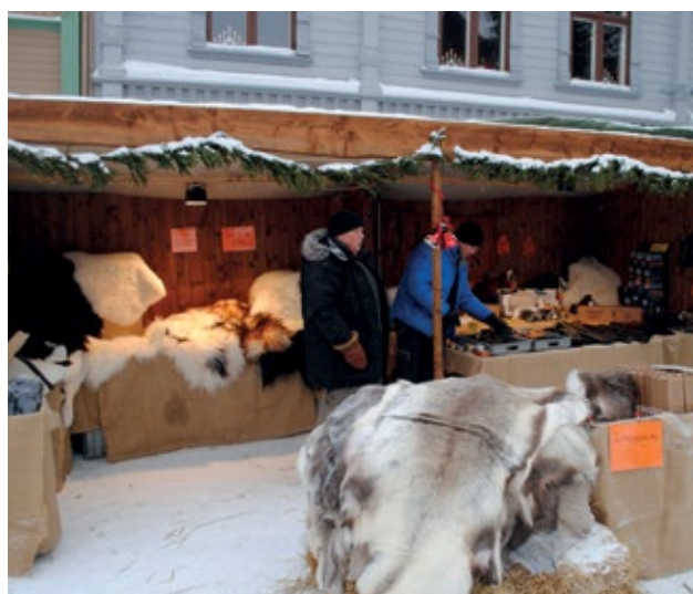
Nr. 2 Brun trebod 6 m