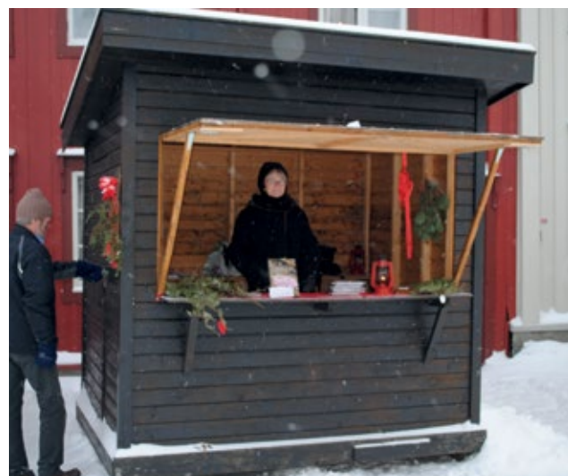
Nr. 3 Kioskbod