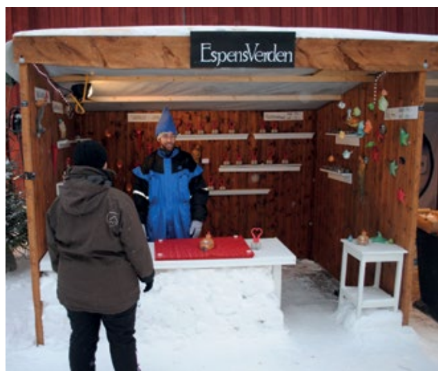
Nr. 1 Brun trebod 3 m