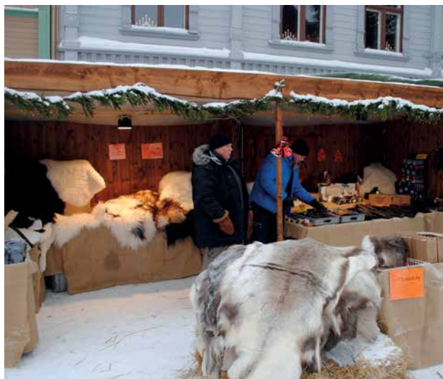
Nr. 2 Brun trebod 6 m