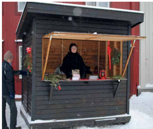
Nr. 3 Kioskbod