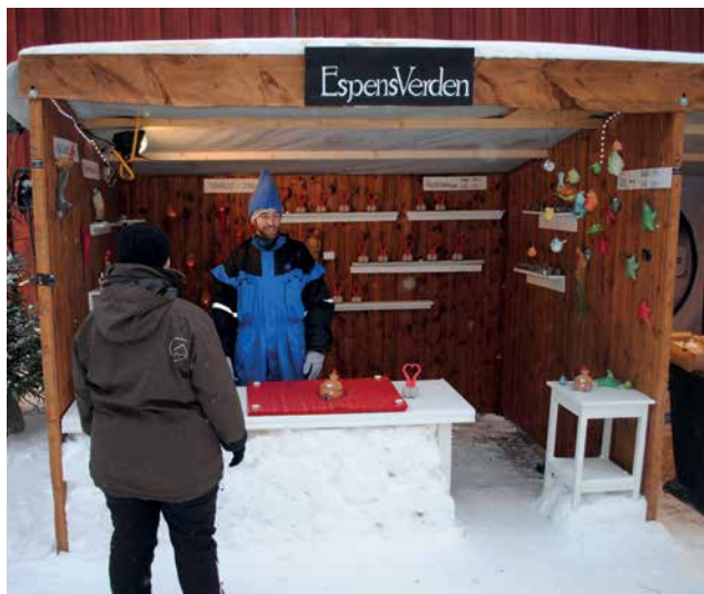
Nr. 1 Brun trebod 3 m